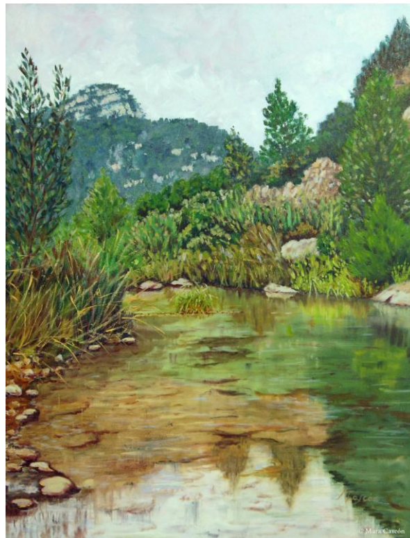
33. SE PARÓ EL TIEMPO O/L 50x65 ©Mara Cascón